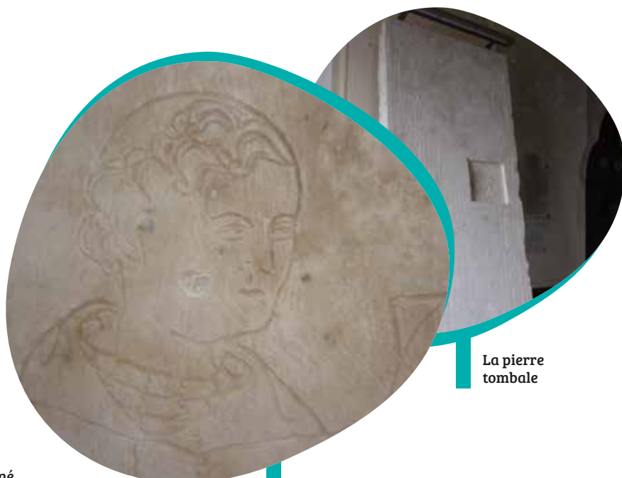
La pierre tombale