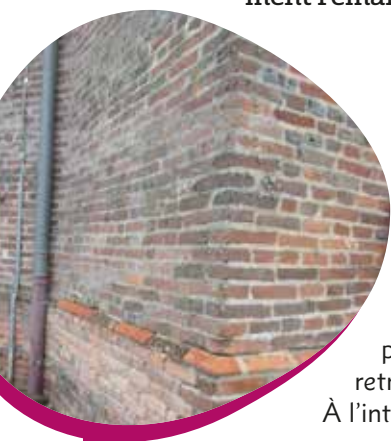
Réfection des sous-bassements

Bâtie auprès des eaux calmes du Solnan, l'église de Sainte-Croix construite en briques attire notre regard de jour comme de nuit par ses couleurs chaudes. Elle daterait du XIII e siècle (la première église du XIII e siècle était constituée du chœur actuel) et elle a été fortement remaniée jusqu'à nos jours.