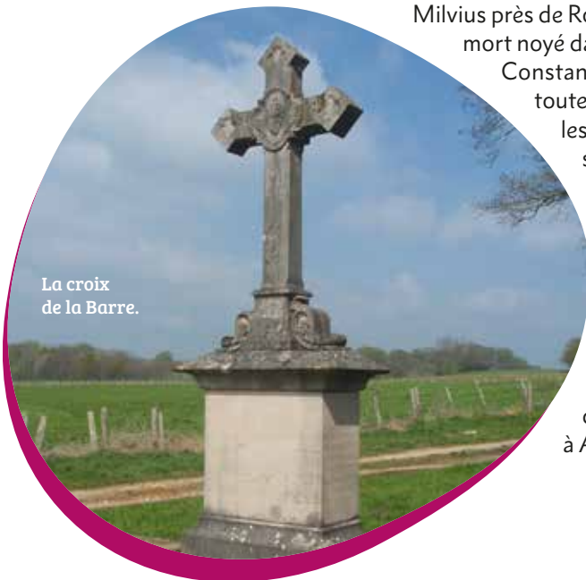
La croix de la Barre.

Depuis des lustres, le village a entretenu cette mémoire, ce qui lui valut l'afflux de nombreux pèlerins dans les temps les plus anciens. L'abbaye de Gigny en prit ombrage. Les moines déployèrent en vain des tentatives pour y déplacer le pèlerinage. Au XIX e , un miracle vint relancer la croyance immémoriale : Thérèse de Renouard de Sainte-Croix, âgée de 27 ans, atteinte d'un mal incurable y fut guérie le 11 août 1876. Aujourd'hui, la croix est toujours fleurie preuve d'un attachement certain à la tradition immémoriale.