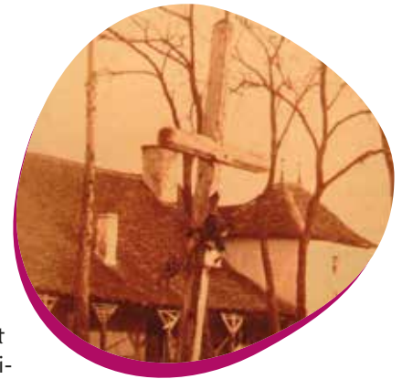
Ancienne croix de Constantin.